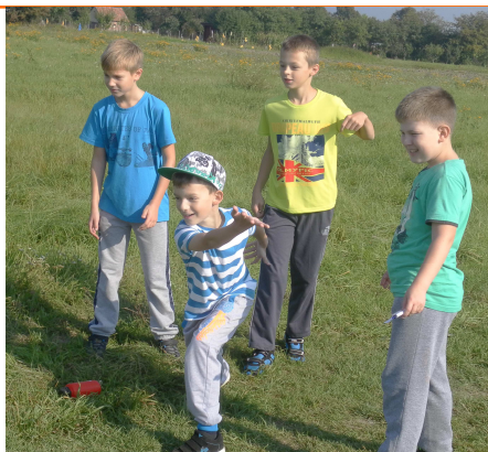
Žiaci 5.A v akcii