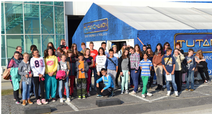
Žiaci, ktorí mali možnosť zúčastniť sa exkurzie zdarma