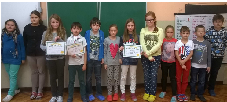
Všetci účastníci súťaže v anglickom hláskovaní spolu s víťazmi