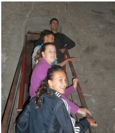
Výstup do veže