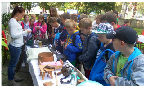
Piatáci a šiestaci usilovne hádajú