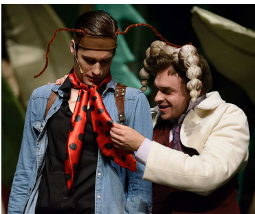
Záber z predstavenia Ferdo Mravec

Statočný Ferdo opustil svoje mravenisko, aby dokázal veci nevidané – neslýchané: zapriahol slimáka do vozíka, skrotil lúčneho koníka a nakoniec porazil v rytierskom súboji aj strašného mravcoleva! A to všetko preto, aby zachránil rodné mravenisko a zapáčil sa slečne Lienke. Okrem toho si Ferdo našiel aj nových kamarátov: vševodka Truhlíka, rádioamatéra Cvrčka či bojzlivého koníka.