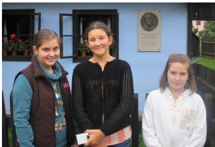
Siedmačky v Jasenovej

Prvou zastávkou bola dedinka Jasenová, v ktorej sa narodil známy slovenský spisovateľ Martin Kukučín. V jeho rodnom dome náš už čakala pani lektorka. Tá v pútavom výklade podala informácie o jeho detstve, mladosti, štúdiách, učiteľovaní i lekárskom pôsobení v zahraničí. V dome nás najviac zaujala kolíaska, v ktorej sa kolísal malý Matej Bencúr. Dozvedeli sme sa tiež