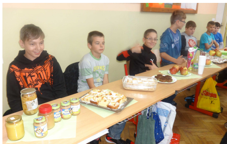
Šiestaci a ich pohostenie