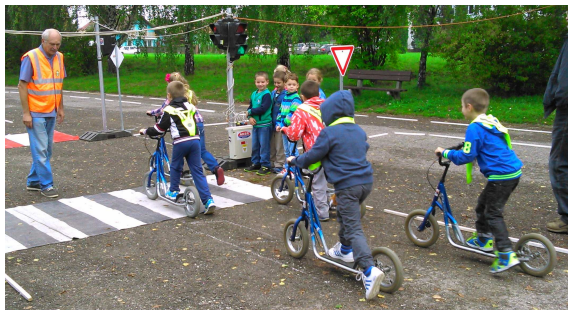
Učíme sa jazdiť