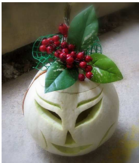
Vítazná tekvica Lucie Koryťákovej

Súťaž o najkrajšiu tekvicu vyhlásilo v dňoch 25. – 28. októbra Slovenské národné múzeum –Múzeum Bojnice. Pod vedením pani učiteľky Šutovej sa do nej zapojilo viacero detí našej školy.