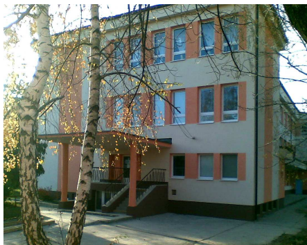
Zrekonštruovaná budova školy

Ďalšou novotou tohto školského roka bolo vypočutie si slovenskej národnej hymny, ktorá sa povinne na školách hrá na začiatku a na konci školského roka.