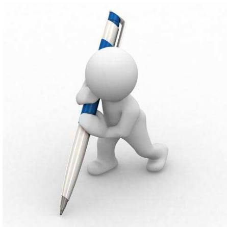
Písať s vervou...