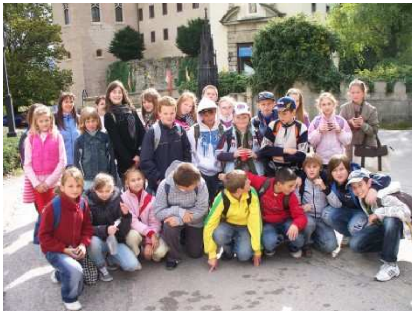
6.A a 6.B pred Bojnickým zámkom

Dňa 30. 9. a 1. 10. 2010 sa uskutočnili krátke exkurzie do Bojnického zámku. Účastníci sa preniesli do nám už minulých časov, časov rytierov a hradných pánov. Mali možnosť zažiť neuveriteľné dobrodružstvá. Pri niektorých vynikla ich udatnosť, pri iných sila a učelivosť. Iba tí najlepší sa mohli stať rytiermi.