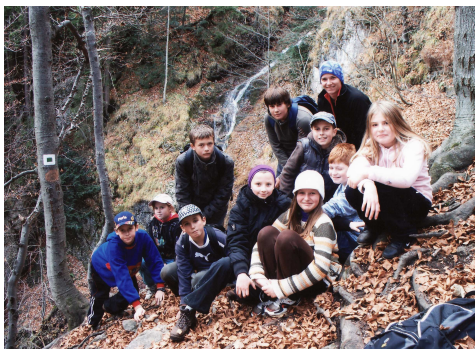
Členovia turistického krúžku na Kľáčskom vodopáde