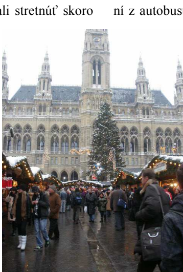
Vianočná Viedeň

Viedeň nás príjemne prekvapila. Trhy napriek tomu, že neboli najväčšie, mali svoju vianočnú atmosféru. Ihličím ozdobené stánky sa nachádzali blízko parlamentu. No po vystúpe-