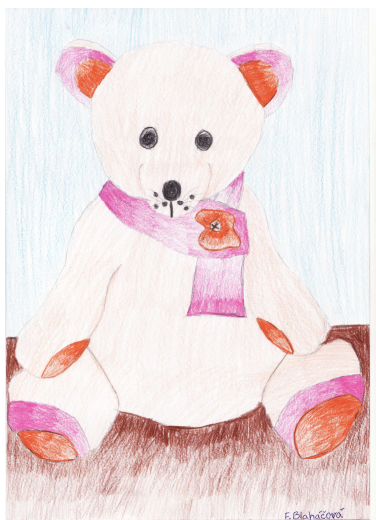
Kresba: Frederika Blaháčová, 5.B