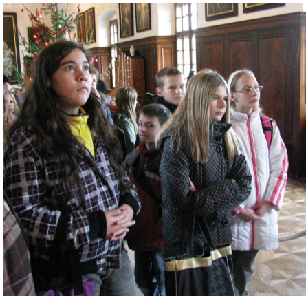
Piataci v Bojnickom zámku

22. decembra 2010 využili žiaci piateho ročníka pod vedením pani učiteliek Jančovej a J. Pišovej posledný predvianočný deň v škole na návštevu Bojnického zámku. Tu si v rámci podujatia Vianoce na zámku obhliadli nielen pekne vyzdobené stromčeky, ale získali i balík plný sladkostí od Mikuláša.