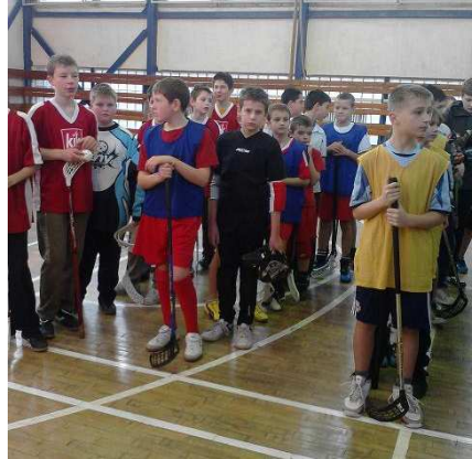
Súťažiaci v kategórii mladší žiaci

6.5.2011 – chlapci 11. (z 25), dievčatá 21. (z 26)