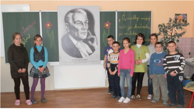
Účastníci súťaže z prvého stupňa

22. marca 2011 sa v priestoroch našej školy uskutočnilo školské kolo súťaže Hviezdoslavov Kubín. Zúčastnilo sa jej viacero žiakov všetkých vekových kategórií.