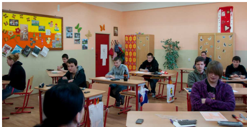
Foto: Naši deviataci pripravení písať monitor.

veň ich vedomostí a zároveň pre nich predstavovalo vstupenku na vybrané stredné školy. Ako monitor prebiehal, prezradí vám na nasledujúcej strane jeden z nich.