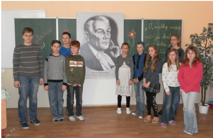
Účastníci súťaže z druhého stupňa