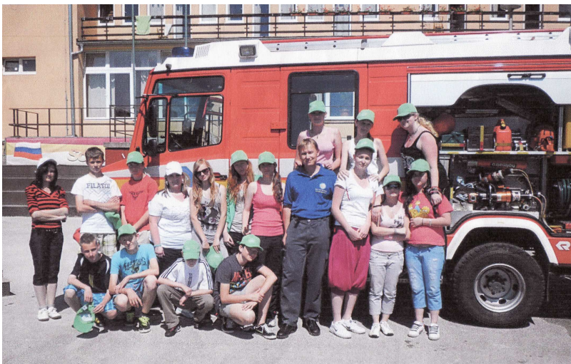
Spolu s hasičmi

Super sme sa zabavili aj pri športoch. Najväčšia zábava však bola na futbale,