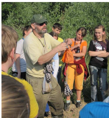
Medzinárodný deň biodiverzity

Prvý stupeň v máji absolvoval stretnutie s canisterapeutkou. Canisterapia využíva pozitívne pôsobenie psa na fyzickú, psychickú a sociálnu pohodu človeka.