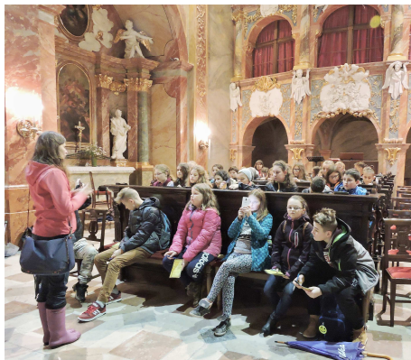
V Katedrále sv. Emeráma

Bola som v Nitre. Síce nebolo priaznivé počasie, ale aj tak to bolo fajn.