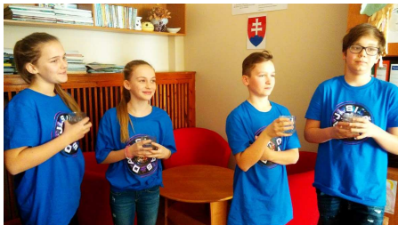
Vítazný tím u pani riaditeľky