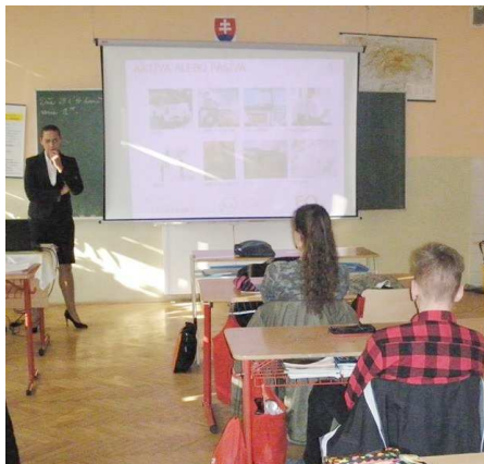
Žiaci 9.B pri prednáške