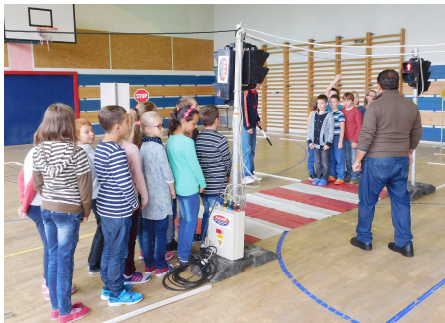
Prechádzanie cez prechod

Dňa 6. októbra 2016 absolvovali žiaci prvého stupňa našej školy vyučovanie na prenosnom dopravnom ihrisku. Pracovníci z Handlovej ho tento rok pre nepriaznivé počasie nainštalovali v priestoroch telocvične.