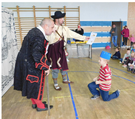
Pasovanie za prvákov na podujatí Cesta slovenskou históriou, 3. 10. 2016