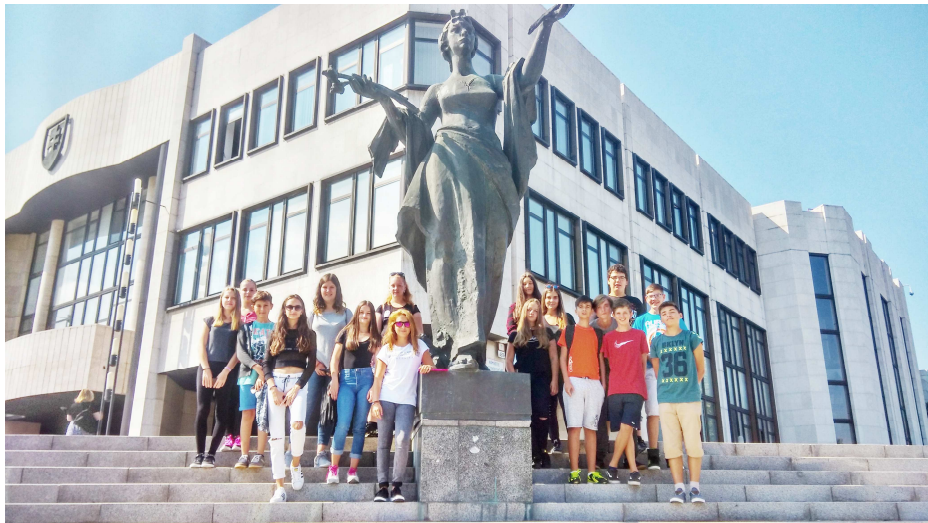
9.A pred budovou NR SR