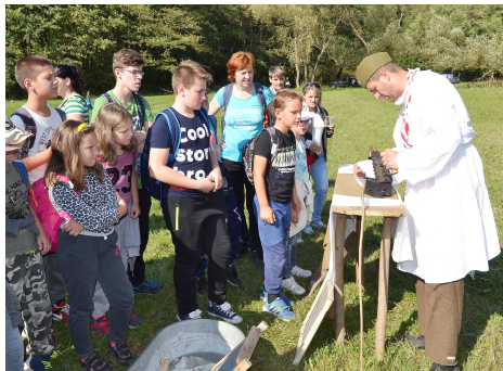
Žiaci pri poľnej nemocnici

Členovia krúžku v tento deň vystúpili aj na Temešskú skalú, odkiaľ sa pokochali nádherným výhľadom na celú dolinu. Prežili snečný deň v krásnej prírode, na ktorý budú ešte dlho spomínať.