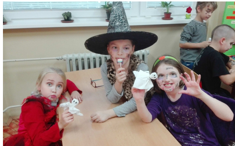
Tretiačky a ich výtvary

V stredu 19. októbra žiaci 3.A zažili zábavnú tvorivú výtvarnú výchovu na tému Halloween. Najprv si vzájomne farbami pokreslili tvár rôznymi strašidelnými motívmi, ktoré potom niektorí žiaci doladili aj kostýmom. Na hodine okrem kreslenia žiaci tancovali a ochutnávali strašidelnú lízanku, ktorú doma vyrobila ich spolužiačka.