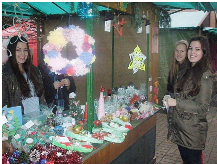
Predaj na vianočných trhoch