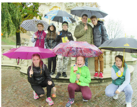
Časť 7.A pred morovým stĺpom

Pani sprievodkyňa nám porozprávala o Svätoplukovi a troch prútoch, aj o kniežati Rastislavovi a našich vierozvestcoch Konštantínovi a Metodovi. O nich sme už vedeli, že Veľkej Morave doniesli písmo v čase, keď ju ohrozovali Frankovia. Ďalej sme šli cez vstupnú bránu a vošli sme do Katedrály sv. Emeráma, na výstavbu ktorej boli použité tri umelecké slohy - románsky, gotický a barokový. V kostole nám naša pani sprievodkyňa porozprávala o mužoch, ktorí boli tak oddaní Bohu, že sa z nich stali pustovníci.