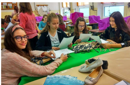
Dievčatá sa chystajú na prácu