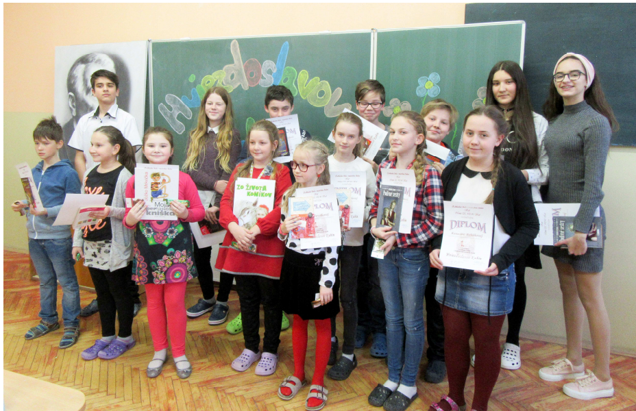
Vítazi tohtoročného školského kola súťaže Hviezdoslavov Kubín

Vyučujúce slovenského jazyka a literatúry