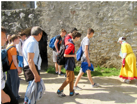
Žiaci pozorne sledujú výklad na Beckove

Vo štvrtok 18. mája sa žiaci 7. a 8. ročníka vybrali na dejepisnú exkurziu. Ich kroky viedli k zrúcanine hradu Beckov a následne do Parku miniatúr v Podolí. Mohli tak naživo vidieť nielen súčasnú, ale vo forme modelu i tú niekdajšiu podobu hradu, ktorý vyhorel približne pred 300 rokmi.