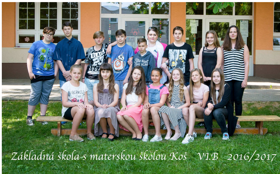
Základná škola s materskou školou Koš VI.B 2016/2017