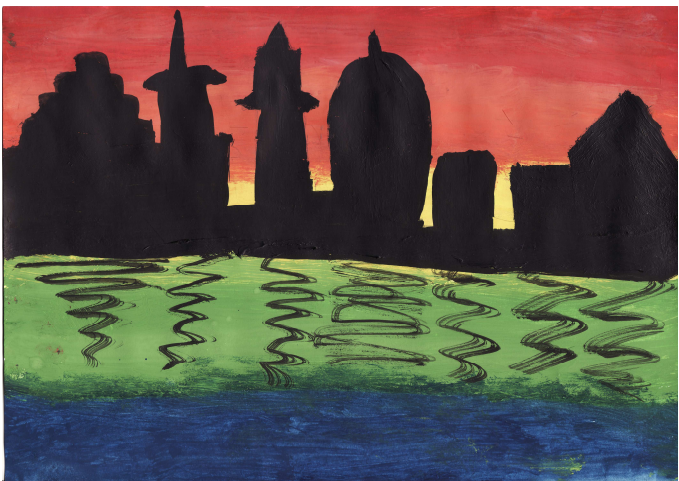
Ilustrácia: Nikola Mokrišová, 7.B