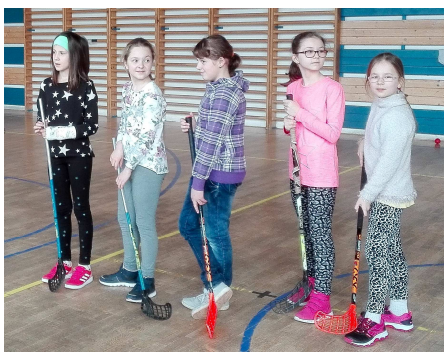
Budúci piatáci pri návšteve v telocvični